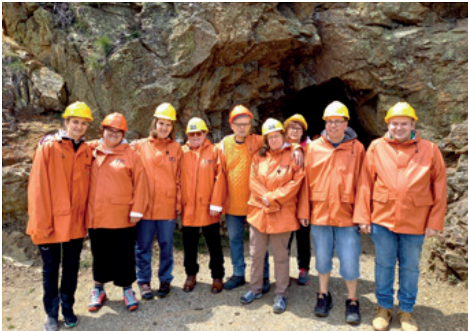
Die Freizeitgruppe im Bergwerk von Villanders

SELF bedeutet Selbstständigkeit, Eigenverantwortung, Lebensfreude, Freizeit.