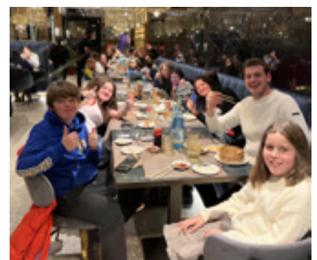
Der Sushi-Abend fand regen Zuspruch.

rant „Miho“ nahe dem Messegelände. Die Vorfreude war groß, denn einige Jugendliche haben zum ersten Mal Sushi probiert. Dort angekommen, erwartete die Gruppe eine einladende Atmosphäre und eine breite Palette an frischen Sushi-Kreationen in den verschiedenen Sorten „Maki“, „Nigiri“ und „Sashimi“. Da die Aktion einen regen Zuspruch gefunden hatte, wurde sie am 26. Jänner mit 16 Jugendlichen aus Karneid und Tiers wiederholt.