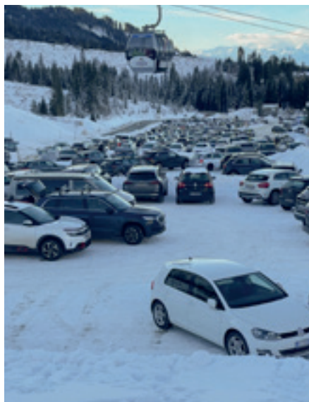
Der neue Parkplatz und die verlegte Straße haben die Feuertauflur zum Jahreswechsel bestanden.